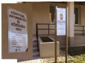
Külső tábla a könyvtár előtt és az épület falán Makláron