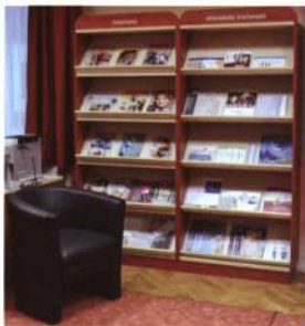
Olvasgatásra csábító berendezés Hercegszántón a régi lapszámok tárolására alkalmas polccal