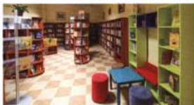
Vidám színekkel hódít a felpécsi könyvtár