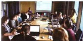
Szakmai nap Kecskeméten a szolgáltató helyek könyvtárosaiban