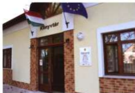
Jól olvasható tábla Nyárlőrincen