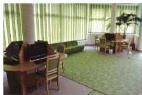
Harmonikus színvilág Kunszőlősen

Meghatározó a könyvtár belsőépítészeti megjelenése, amelynek legfontosabb elemei az egységes könyvtári célbútor, színben is összehangolt kiegészítőikkel.