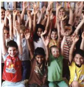
Elégedett kaskantyúú gyerekek

A KSZR szolgáltatás legfontosabb célkitűzése, hogy szolgáltatásai a lakosság minél szélesebb köréhez eljussanak. Ennek érdekében a szolgáltató rendszerben együttműködő partnereknek mindent meg kell tennie. A szolgáltatás eredményességét rendszeresen, de legalább két évente összehasonlítható használói és partnereelégedettség-méréssel szükséges alátámasztani.