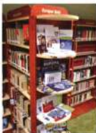
Apostagon külön polcon kaptak helyet az európai uniós információk