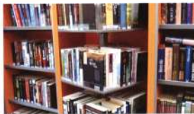
A gyűjtemény kialakítása praktikus, átgondolt