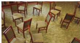
Megérkeztek a kényelmes, minőségi kárpitozott székek Imrehegyre