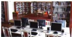
Könyvtár, Információs és Közösségi Hely Katymáron

A KSZR országos hálózatában a települések Könyvtárellátási Szolgáltató Rendszerét alkotó főbb tényezők meghatározása differenciáltan történt. A KSZR egyrészt könyvtári célra kialakított épületben