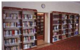
Szakirodalmi állomány Harkakötönyön