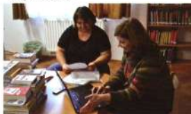
Személyes konzultáció Bugacpusztaházán