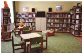
Funkcionális berendezés a gyerekeknek Pálmonostorán