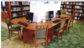
Korszerű számítógépek Páhin