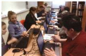
Internethasználati tanfolyam Ácsteszerén