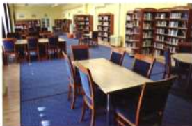
Harmonikusan berendezett, impozáns könyvtár Tatabányán