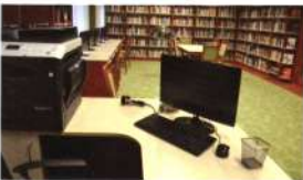
A könyvtárosnak feladatai elvégzéséhez több eszköz is szükséges. Apostagon minden kéznél van.