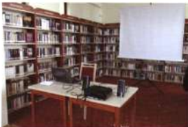
Mobil eszközökkel gyorsan előadótérre alakítható a könyvtár Nyárlőrincen