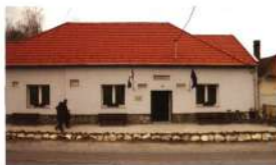
A könyvtár bejárata Dunaalmáson

Az épület a település középpontjában, közforgalmi helyekhez közel helyezkedjen el.