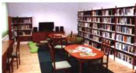
A szűkebb lehetőség kihasználására remek példa Dunaalmáson