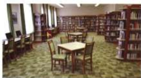
Többfunkciós térkihasználás Hajóson