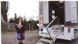
A Guruló könyvtár a benkőbokori tanyán