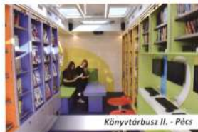
Könyvtárbusz II. - Pécs