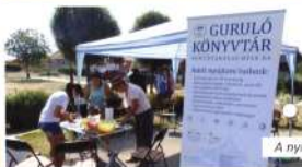
A nyíregyházi könyvtárbusz szolgáltatásai