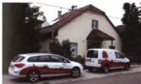
Befutottak az egri könyvtári szolgáltatás gépkocsijai Paródsasvára