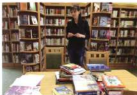
Megérkeztek az új könyvek Fülöpházára