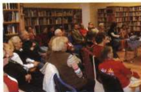
Felnőttek számára szervezett program Maklárán

A megyei könyvtárnak évente legalább négy alkalommal kell olyan könyvtári programokat kínálni – kiállítás, előadás, játékok, versenyek stb. –, amelyek iránt a helyi lakosság érdeklődik. Ösztönözni és segíteni kell a helyi események szervezését, ugyanakkor törekedni kell arra, hogy a szolgáltató helyek mindegyike részt vegyen a kiemelt országos programokban, az Országos Könyvtári Napok rendezvénysorozatában és az Internet Fiestán.