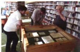
A tágas térben kiállítási vitrin is elfér Bátyán