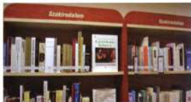
A polcok feliratozása, a könyvek jelzetelese alapvető fontosságú