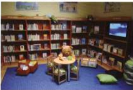
A gyerekek számára Fajszon is rendelkezésre áll korszerű TV-készülék, DVD-lejátszó