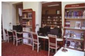
Helyet kaptak a korszerű számítógépes munkahelyek is Nyárlőrincen