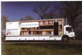
A nyíregyházi „Guruló könyvtár” indulásra kész