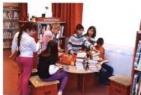
A bócsai gyerekek érdeklődve ismerkednek az új könyvekkel