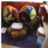
Felső-szentivánon babzsákokkal, üléspárnákkal berendezett kuckó várja a gyerekeket