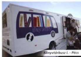
Könyvtárbusz I. - Pécs