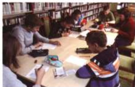
Nagyobb gyerekcsoport foglalkoztatására is alkalmas a könyvtár Bátyán