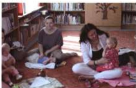
Biztonság, kellemes körülmények között szokhatnak a könyvtári környezethez a babák Akasztón