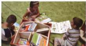
A képeskönyvekkel teli válogatóláda a kicsik kedvence Garán is