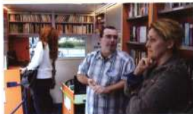
A könyvtáros személye nagyon fontos ennél a szolgáltatásnál is – a pécsi busz könyvtárosa